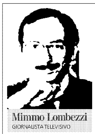
Mimmo Lombezzi GIORNALISTA TELEVISIVO