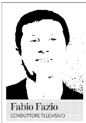
Fabio Fazio CONDUTTORE TELEVISIVO