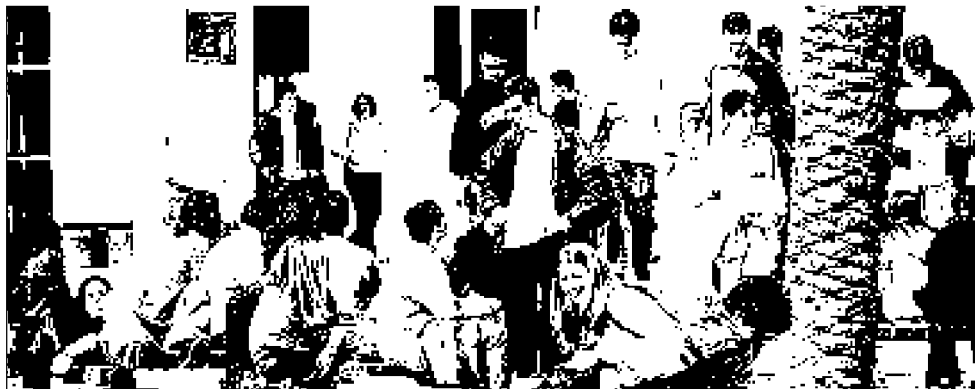
Studenti al campus di Legino durante una pausa delle lezioni